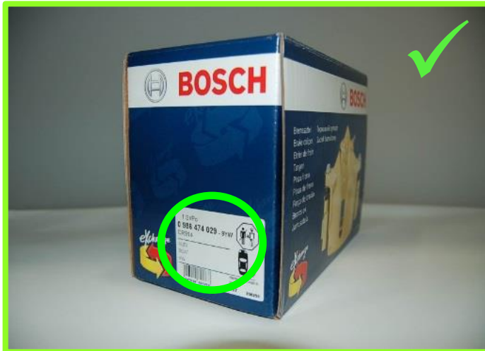
Bremssattel "Back in Box"