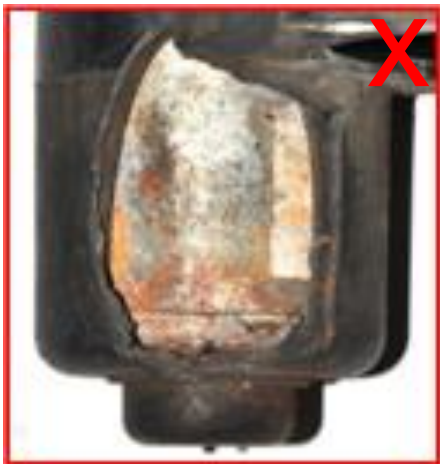
Erhebliche Schäden an Motorgehäuse und / gerissen oder gesplittert Motor → unzulässig