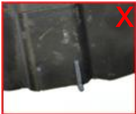
Gebrochene Montagelaschen → unzulässig