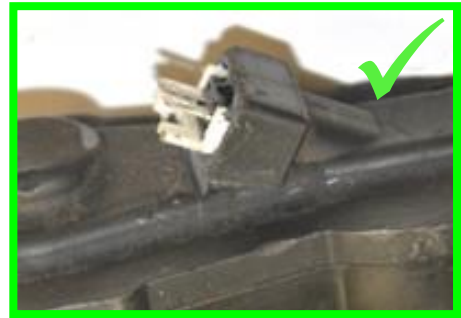
Gebrochen Stecker mit mehr als 5 mm Material Rest → zulässig