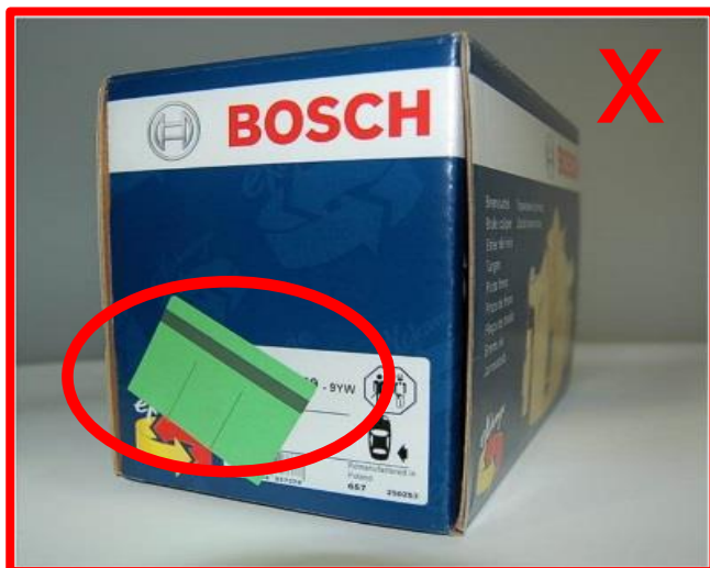
Etikett überklebt / beschädigt / fehlt