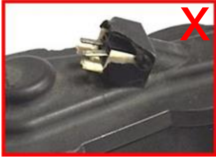
Gebrochen-Stecker mit weniger als 5 mm Material Rest → unzulässig